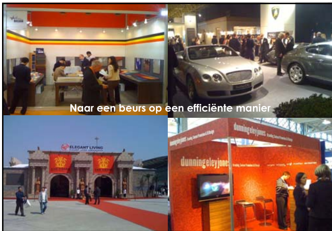
Naar een beurs op een efficiënte manier